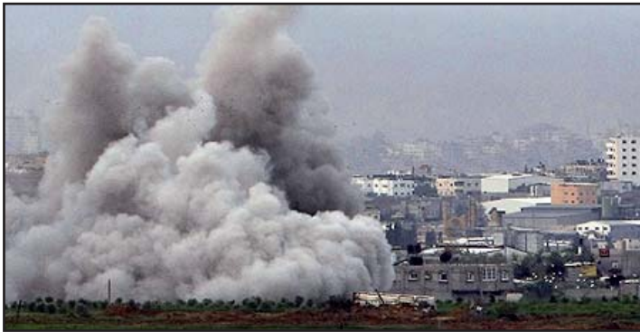
Una explosión, efecto de los ataques de la aviación israelí en la franja de Gaza.