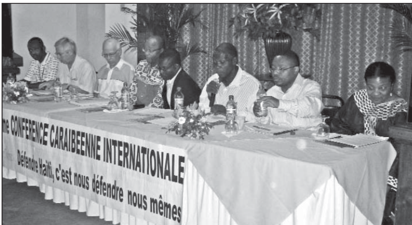
Presidencia de la Conferencia Caribeña Internacional Port-au-Prince, los días 12 y 13 de diciembre de 2008.

Ha sido a partir de la consigna, «¡Defender Haití, es defendernos nosotros mismos!» que ha tenido lugar a finales de diciembre, en Port-au-Prince, la conferencia continental para la defensa de la soberanía de Haití a iniciativa de la Asociación de los Trabajadores y de los Pueblos del Caribe (ATPC), del Acuerdo Internacional de los Trabajadores y de varias organizaciones políticas y sindicales de Haití, entre ellas el Partido Obrero Socialista haitiano (POS), la Central Autónoma de los Trabajadores de Haití (CATH) y la Central Sindical de los Trabajadores de los Sectores Público y Privado (CTSP).